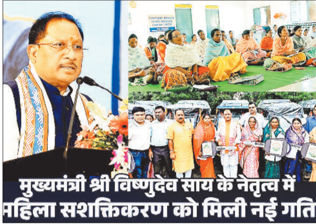
मुख्यमंत्री श्री विष्णुदेव साय के नेतृत्व में महिला सशक्तिकरण को मिली नई गति

साय सरकार की योजनाओं से बदली जशपुर की महिलाओं की पहचान